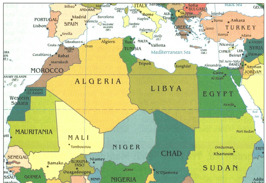
Der nordafrikanische Spannungsbogen von Mauretanien bis zum Suezkanal.

ten an Strassensperren im Westjordanland und im Gaza-Streifen. Sie verkamen zu Schutztruppen.