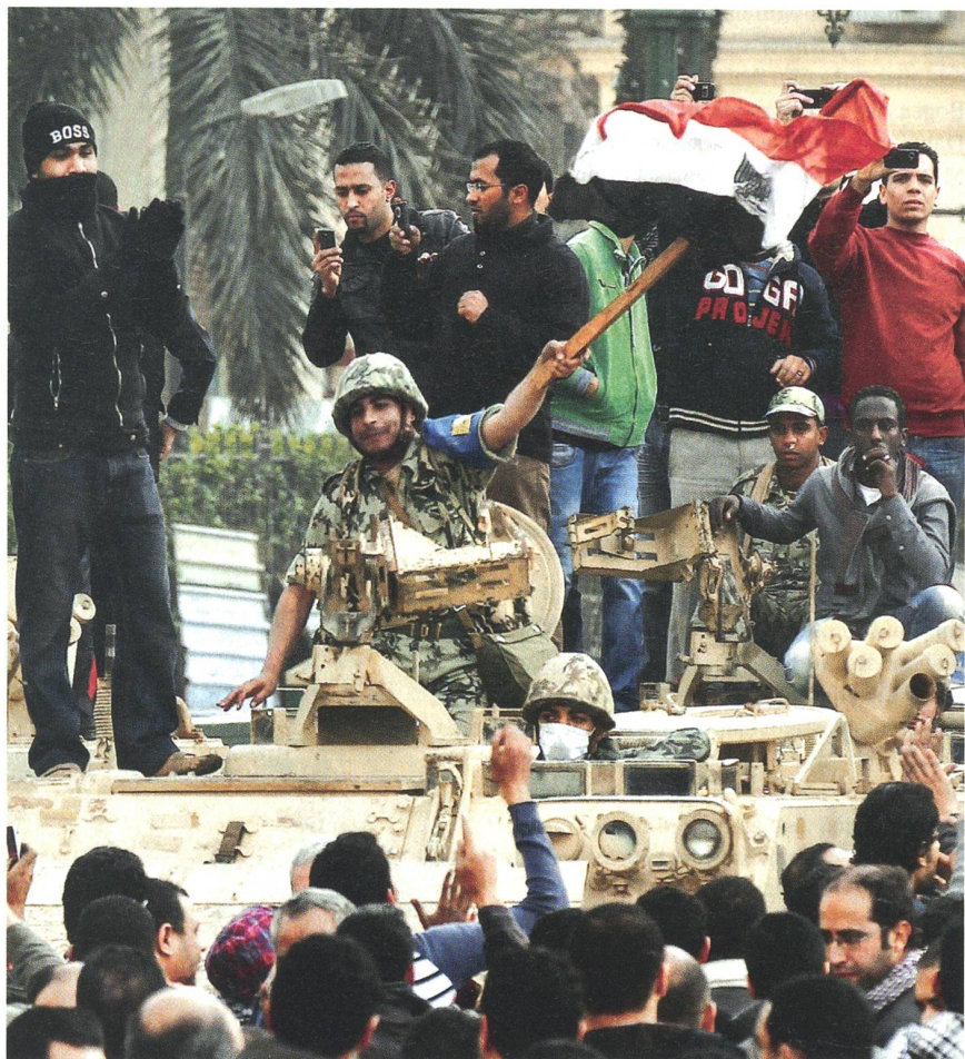
Demonstranten und Soldaten verbrüdern sich auf dem Tahrir-Platz von Kairo.

General Ashkenazi erneuerte die israelischen Streitkräfte gründlich und mit Erfolg. In Erinnerung bleibt auch sein gestörtes Verhältnis zum Verteidigungsminister Ehud Barak, der selber einmal Generalstabschef gewesen war. Barak gehört mit Premier Netanjahu zu denjenigen Israeli, die sich einen militärischen Angriff auf die iranischen Atom-Anlagen vorstellen