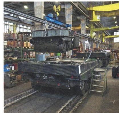
In einer RUAG-Werkhalle.