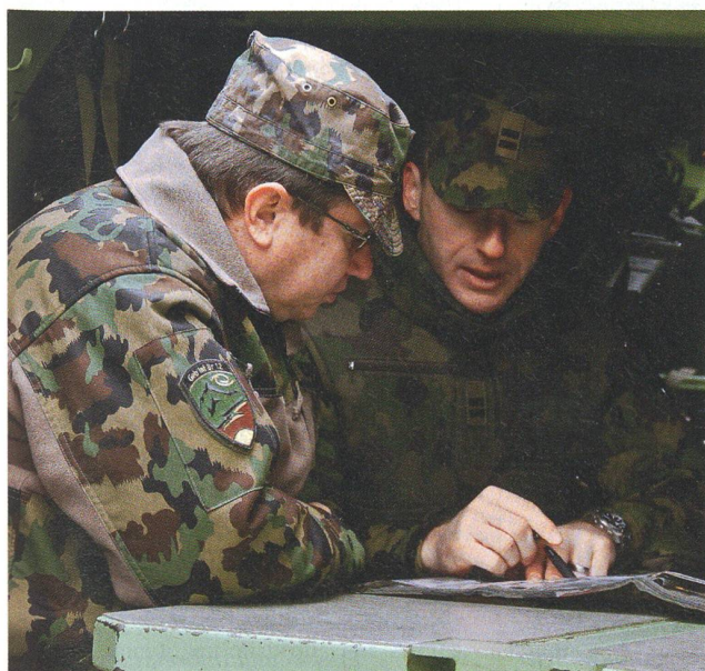
Planung für das Gefecht, Führung im Kampf.