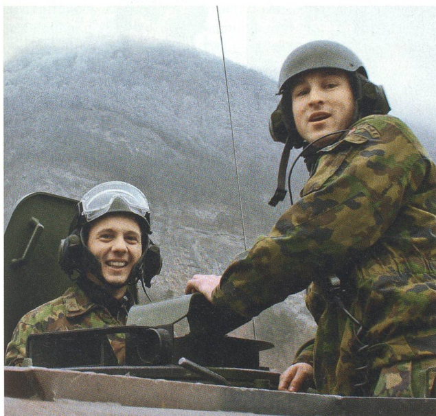
Digitale Kämpfer gut gelaunt auf der St. Luzisteig.