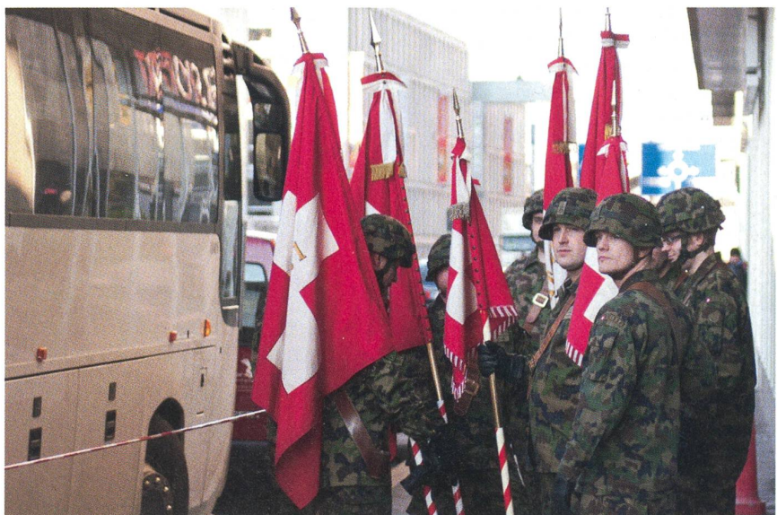
Ein Schnappschuss: Die Fähnriche warten auf den Einmarsch mit ihren Feldzeichen.