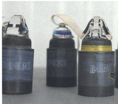
Moderne ausländische Artilleriemunition.

In diesem Zusammenhang fordert die FDP den Bundesrat auf, die wichtige Frage zu beantworten, wie die Schweizer Armee nach einem Verbot der Streumunition die Fähigkeit zur Bekämpfung von Flächenzielen erhalten kann und gleichzeitig das Potenzial einer Gefährdung der Zivilbevölkerung und eigener Truppen reduziert. Bevor