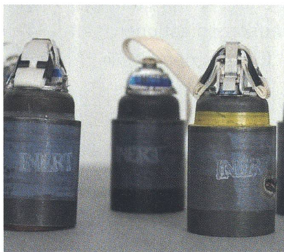
Moderne ausländische Artilleriemunition.

In diesem Zusammenhang fordert die FDP den Bundesrat auf, die wichtige Frage zu beantworten, wie die Schweizer Armee nach einem Verbot der Streumunition die Fähigkeit zur Bekämpfung von Flächenzielen erhalten kann und gleichzeitig das Potenzial einer Gefährdung der Zivilbevölkerung und eigener Truppen reduziert. Bevor