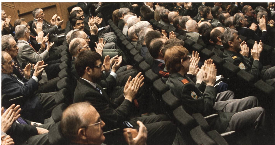
Wie stets an der MILAK-Frühjahrstagung ist der Saal voll.