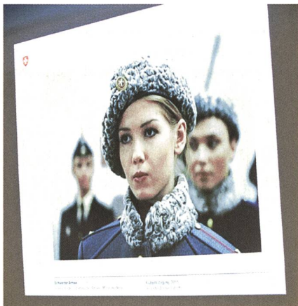
Nur auf der Leinwand...