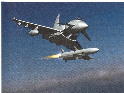
Soeben ist eine Meteor-Luft-Luft-Lenkwanne von einem Kampfflugzeug abgeschossen worden.

Meteor wird damit zum Konkurrenten der amerikanischen Luft-Luft-Lenkwanne AMRAAM, von der die Schweiz mit dem Rüstungsprogramm 2011 ca. 120 Stück beschaffen will. +