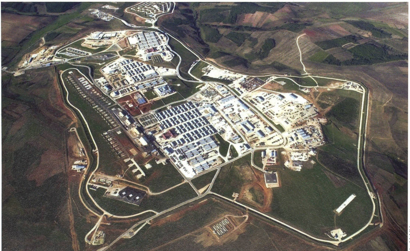
Camp Bondsteel: Von diesem Stützpunkt aus operiert seit dem 18. November 2010 das Schweizer Helikopter-Detachement.

Die Basis ist nach James Leroy Bondsteel, einem Vietnam-Helden, benannt. Bondsteel ist der grösste Stützpunkt, den die USA seit dem Indochina-Krieg bauten. red.