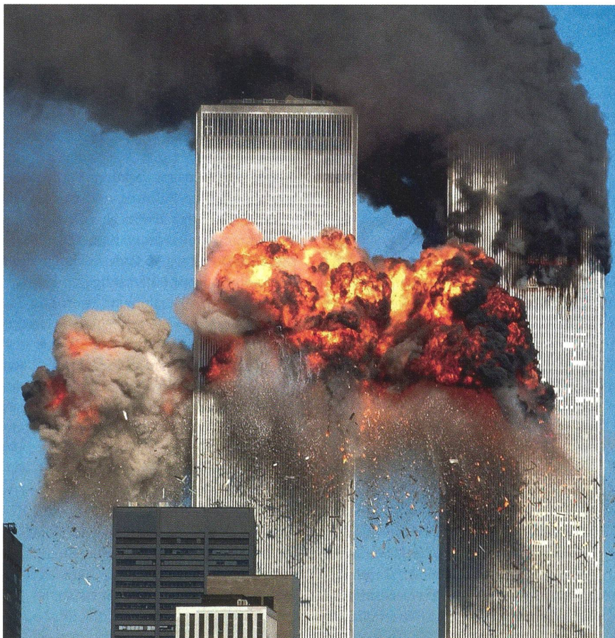
Rund 2750 Menschen starben, als zwei Passagierflugzeuge am 11. September 2001 in die Türme des New Yorker World Trade Centers flogen.

In den beiden Chinooks dürften weitere SOF bereitgestanden haben, insgesamt wird von einem Kontingent von 60 bis 70 Personen vor Ort ausgegangen. Die Maschinen sollen auch Treibstoff mitgeführt haben, hätten als Exfiltrationsplattformen und als Reserve gedient. Nach der Bruch-