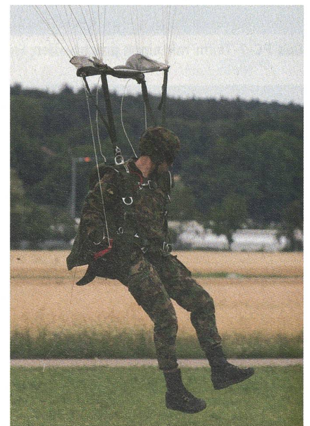
Vom Himmel hoch, da komm ich her...