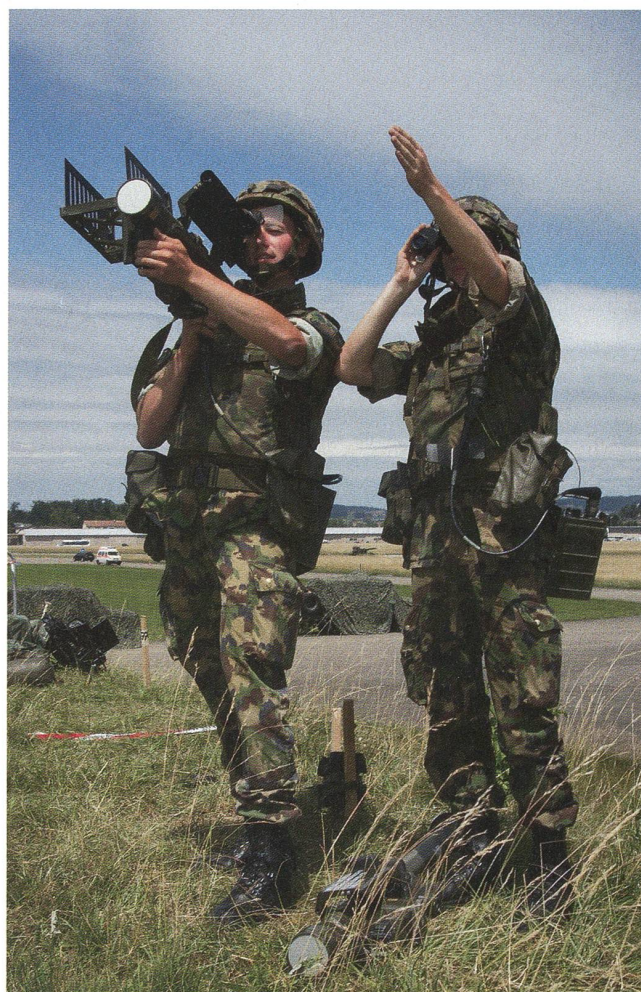
Mit TRIO vorwärts: Die Stinger-Rakete als dritter TRIO-Teil.