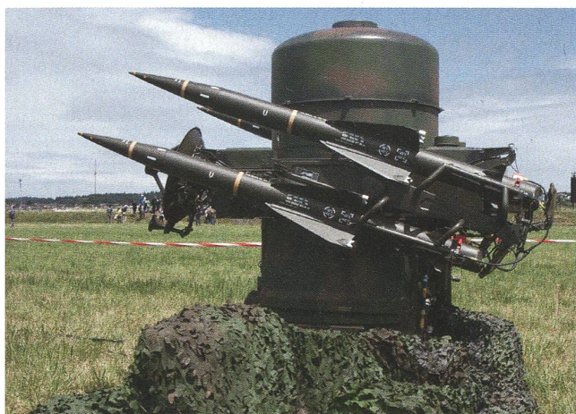
Mit TRIO vorwärts: Der Rapier, ein zweiter Teil vom TRIO.