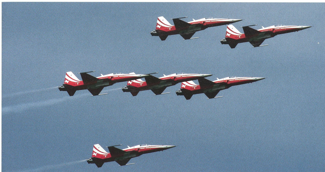
Immer ein Höhepunkt für das zahlreiche Publikum: Die Patrouille Suisse mit ihren sechs Tiger-Maschinen am blauen Himmel.