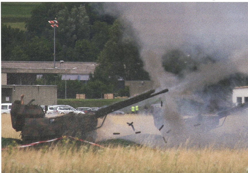
Mit TRIO vorwärts: Die 35-mm-Fliegerabwehrkanone, ein erster Teil vom TRIO.