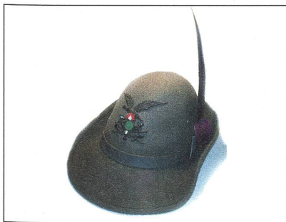
Mannschaftshut mit schwarzer Feder.

Den Hut mit der Feder führten die Alpini im März 1873 ein. Die auffällige Kopfbedeckung orientierte sich an Modellen, die in den Volksaufständen in Venedig, in Mailand und im Cadore getragen wurden.