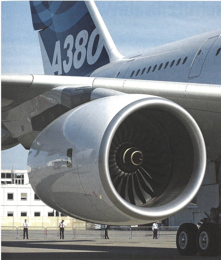
Auch im Airbus A380 unterstützen Sensoren von Meggit Sensing Systems die Piloten.

Betriebssicherheit nicht erfüllte. Dank dem Know-how von Vibro-Meter gelang zusammen mit der Swissair der Einstieg in die Überwachung von Flugzeugtriebwerken. Im Dezember 1967 war die Ausrüstung der acht Coronados mit neuentwickelten Sensoren abgeschlossen.