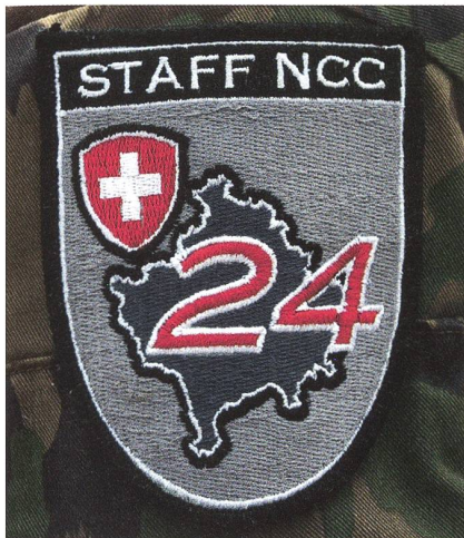
Die Variante für den Kommandantenstab.

Der Badge spricht für sich selbst. Er enthält das Schweizerkreuz, die Umrisse von Kosovo, die rote Nummer 24 für das Kontingent und die Spezifizierung Staff NCC , Stab des Nationalen Befehlshabers.