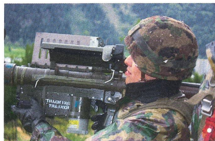
Besuch bei der Fliegerabwehr: Stinger-Schützen beweisen ihr Können