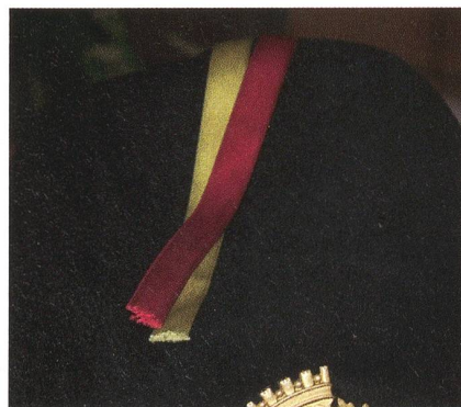
Was liegt oben? Ehre oder Blut?

Zum Schluss fiel das Augenmerk auf die schwarzen Berets der Militärpolizisten, die alle mit je einem goldenen und roten Bändel geschmückt sind. Der Korporal