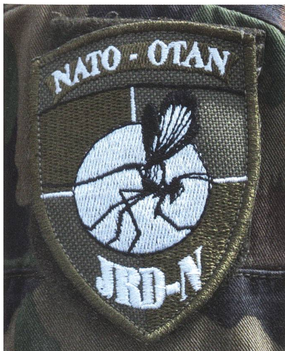
Selten zu finden auf Badges: Ein Insekt.

Die NATO hat das Kosovo-Territorium neu in Joint Regional Detachments eingeteilt. Das ist der Badge des Nord-Detachements, das unter französischer Verantwortung steht – mit der NATO/OTAN-Abkürzung in englischer und französischer Sprache, der Abkürzung für das Detachement und einem Insekt.