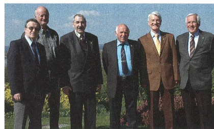
Das Fähnlein der sechs Aufrechten.

Wohin man geht, wenn es um eine Veranstaltung zugunsten der Schweizer Armee geht – eine Gruppe ist stets vor Ort: Der Unteroffiziersverein Schaffhausen. Unter