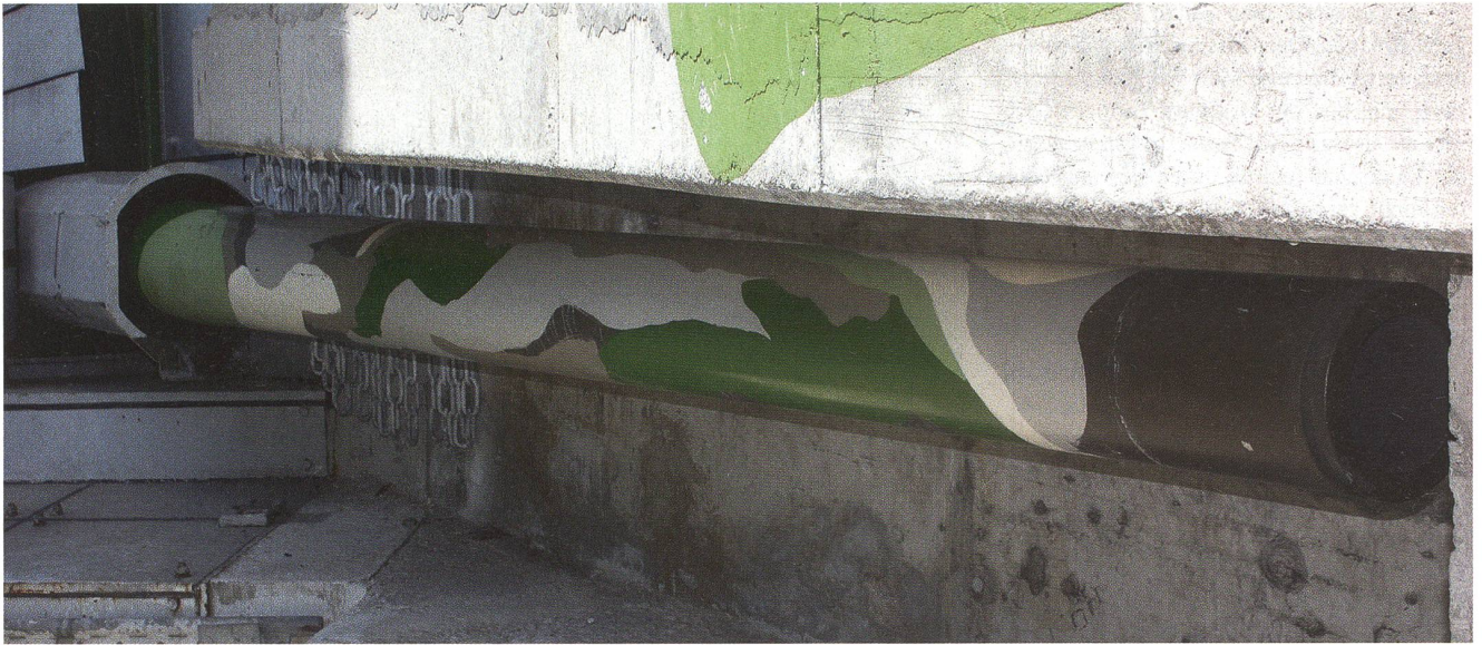
Das mächtige 155-mm-Rohr in der «Rohrgarage». In der «Garage» wird das Rohr sozusagen «parkiert».

Funktion aufzugeben und den vollständigen Rückzug der gesamten Schweizer Armee ins Réduit.