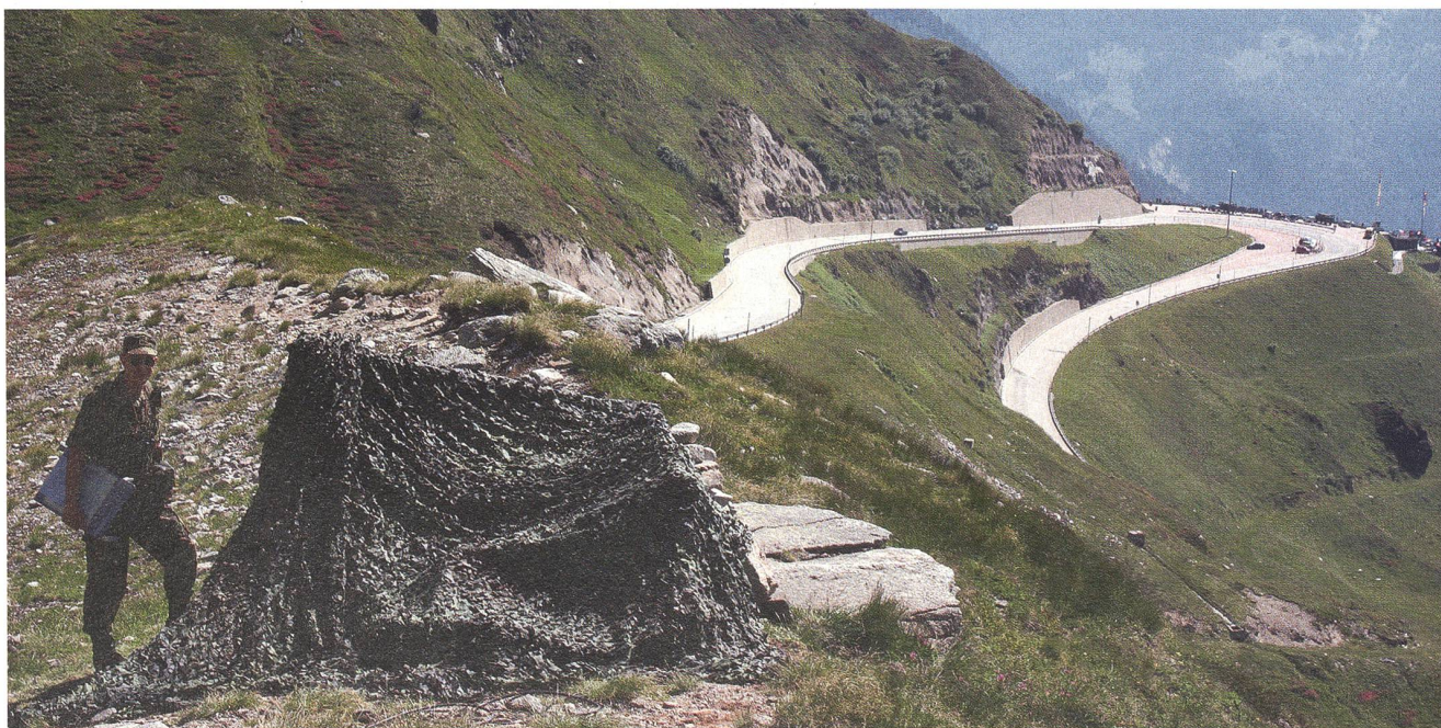
Irgendwo an einer transalpinen Passstrasse hat sich der Schiesskommandant gut und zweckmässig eingerichtet.

Die Eröffnung des Gotthardtunnels 1882 stellte fortan die kürzeste Verbindung zwischen Deutschland und Italien dar. Da Deutschland, Italien und Österreich-Ungarn sich zum Dreibund zusammenschlossen, stand die Schweiz nun als wichtiges Durchgangsland im Zentrum. Diese Umstände veranlasste die Schweiz noch vor Ausbruch des Ersten Weltkriegs mit erneuten Befestigungsarbeiten zu beginnen, einerseits im Tessin, andererseits auch auf der Nordseite.