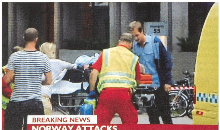
Das Fernsehen liefert auf allen Kanälen Beiträge über das Attentat in Oslo.