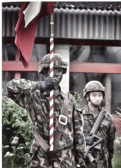
Schweizerfahne in Chamblon.

Dieses Bild verdanken wir unserem aufmerksamen Redaktor Oberstlt i Gst Matthias Müller, der die Szene bei einem seiner Truppenbesuche in Chamblon aufnahm. Kurz und bündig schreibt er dazu: «Integration und Vielfalt». Dem ist wenig anzufügen ausser der Anmerkung, dass die Redaktion