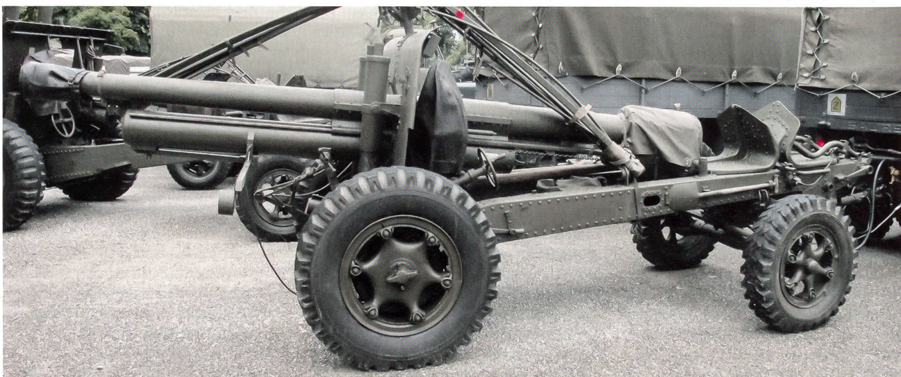
Die Schwere Kanone 10,5 cm, zu ihrer Zeit das beste Geschütz: robust, treffsicher, weitreichend, stationiert in Sion und im Ceneri.