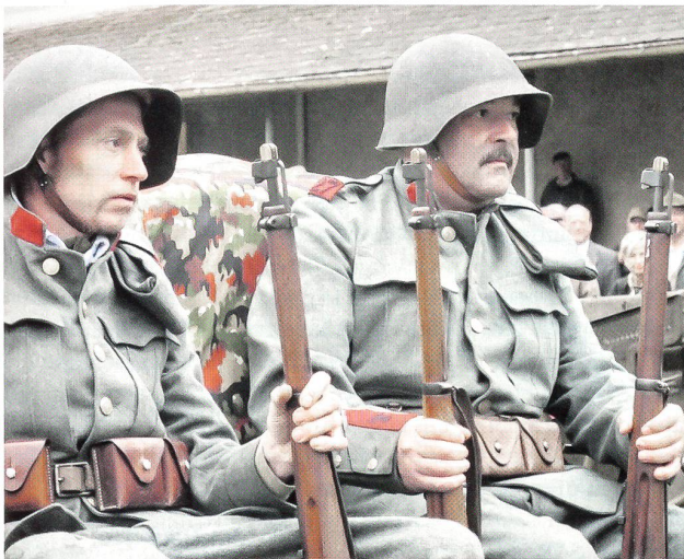
27er Kanoniere mit Stahlhelm und der roten Waffenfarbe.