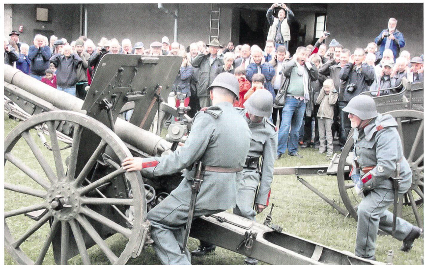
Das «Schliessen» ist in vollem Gang: Richter, Verschlusswart und Geschützführer.