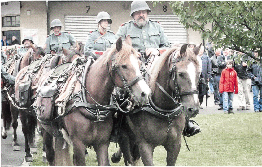
Der Einzug der pferdegezogenen, sechsspännig gefahrenen 7,5 cm Feldkanone 03/12.