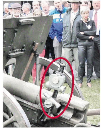
Richtaufsatz mit Regierungsrätin Widmer.