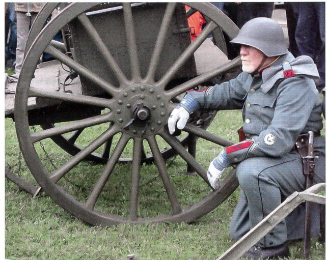
Der Geschützführer-Wachtmeister – mit Gold am Kragen.