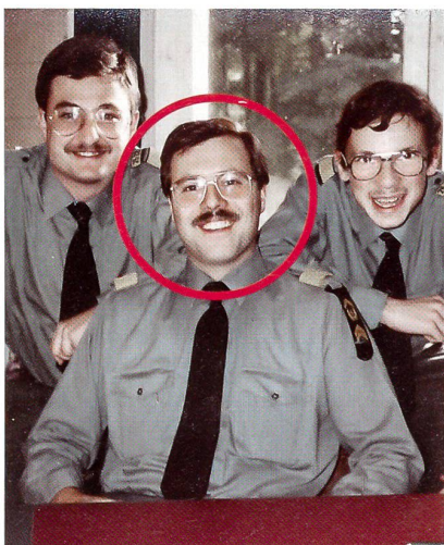
Schulkommando Bure 1983.