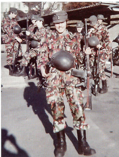
UOS Schwyz 1976.

Lachend sagt er heute: «Meine Logistik ging genau auf. Es war eine geniale Ver-