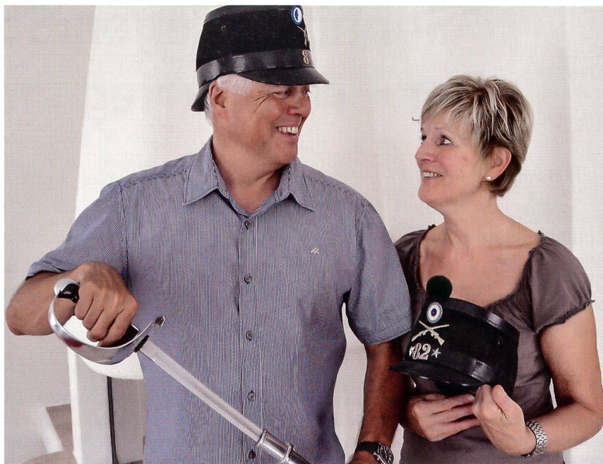
Z'Rotz neben seiner Frau mit Jacotte und Säbel.

«In der nächsten Zeit will ich in England eine Butlerschule besuchen, ohne da-