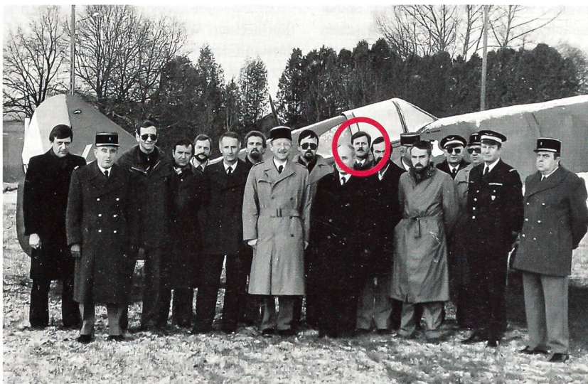
Abkommandiert ins Elsass 1983.