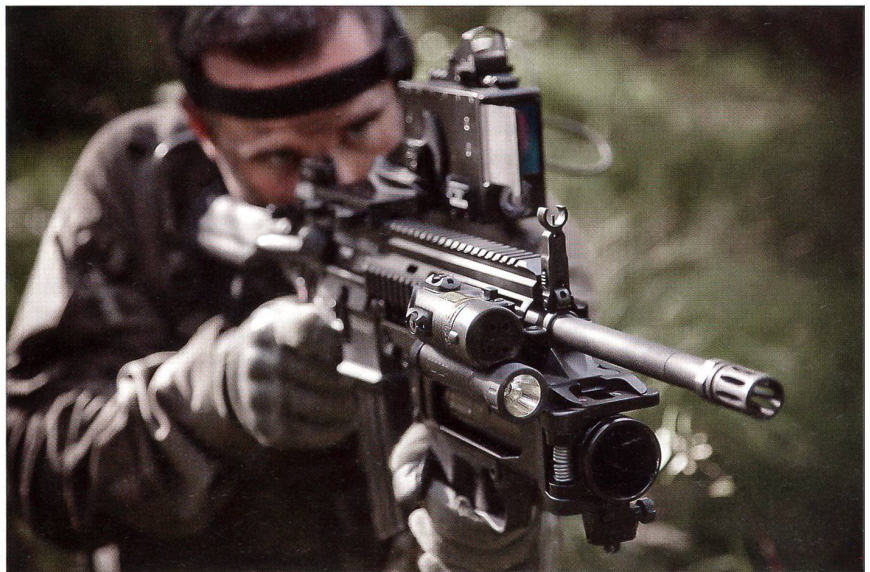
Gut sichtbar ist der am Gewehr angebrachte 40 mm Granatwerfer und die Zielvorrichtungen mit Laser und Lampe.

Mit Skyshield können die Geschosse der 35-mm-Kanone so programmiert werden, dass sie unmittelbar vor dem Ziel explodieren und den Angreifer in der Luft unschädlich machen. Diese Art des Bekämpfens auf relativ kurze Distanz ist kosteneffizienter als zum Beispiel der Ab-