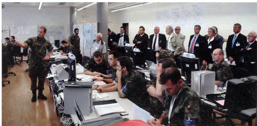
Zahlreiche Gäste beobachten die Übung «STABILO DUE».