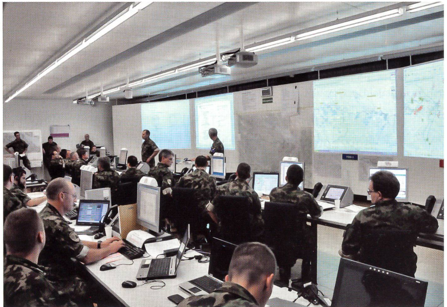
Blick in die Stabsarbeit: Teamwork ist gefragt.