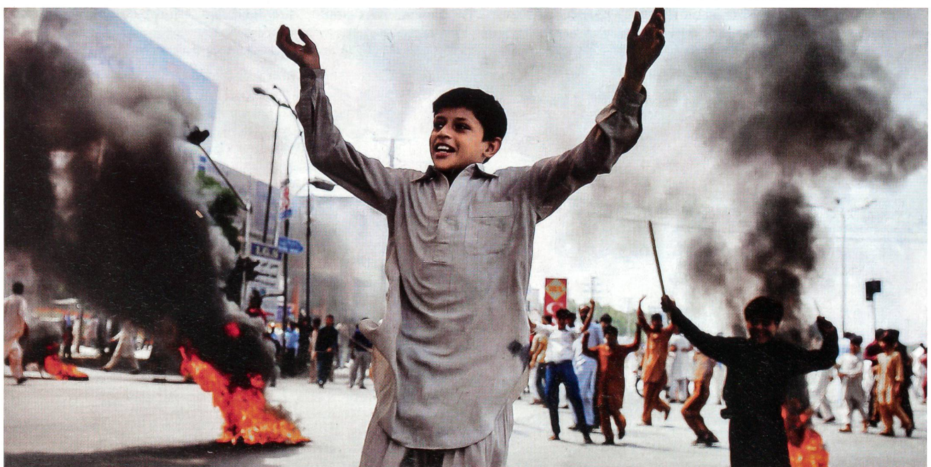
Proteste im pakistanischen Rawalpindi: «Pflicht ist das Töten des Regisseurs, des Produzenten, der Schauspieler.»