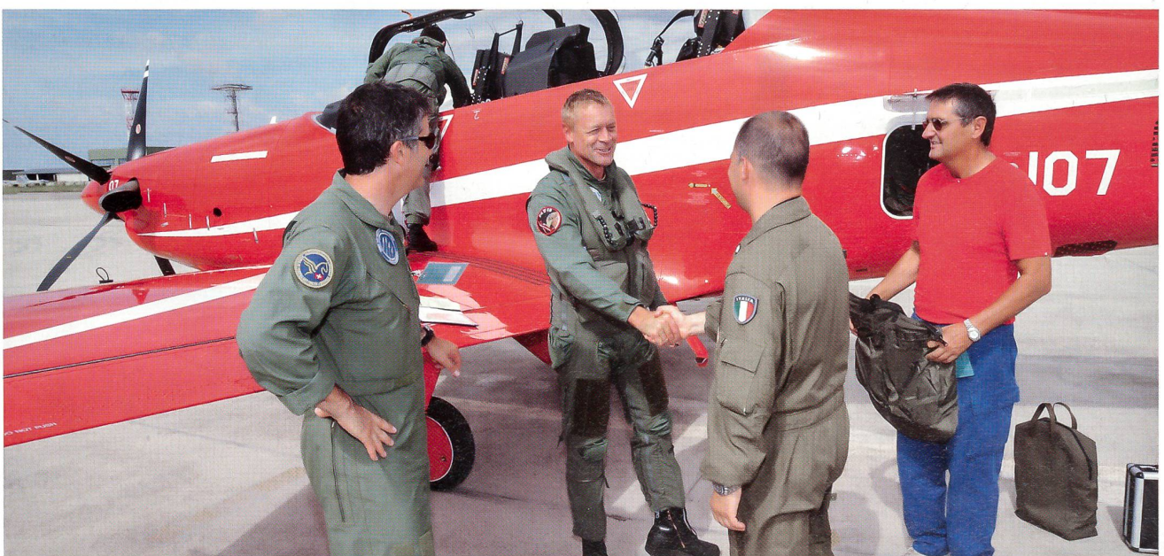
Freundschaftlich-kameradschaftliche Begrüssung im italienischen Galatina bei Lecce.