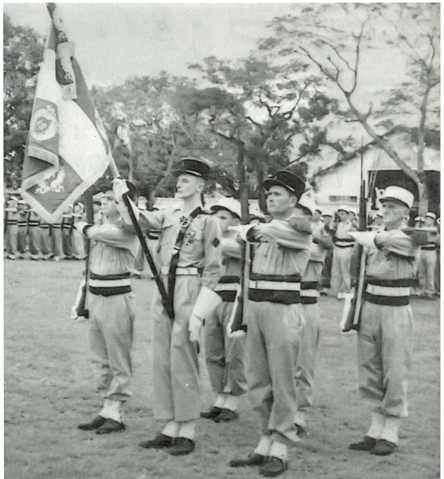
Indochina 1950/51: Fahnen-Detachement des 5 e Régiment Etranger d'Infanterie.

Wie sich aus dem Dossier 98/52/64 der Schweizer Militärjustiz ergab, war dem Kontumazialurteil kein ordentliches Verfahren mehr gefolgt. Walter Weders weiteres Schicksal blieb also ungeklärt, bis dessen Hinterlassenschaft auf eigentümlichen We-