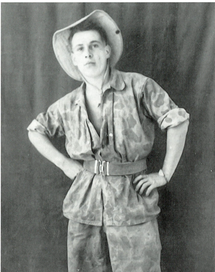
Indochina: Fremdenlegionär im damals gebräuchlichen Dschungel-Kampfanzug.