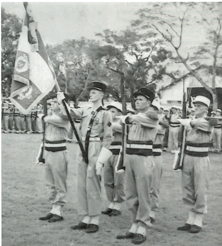
Indochina 1950/51: Fahnen-Detachment des 5 e Régiment Etranger d'Infanterie.

Wie sich aus dem Dossier 98/52/64 der Schweizer Militärjustiz ergab, war dem Kontumazialurteil kein ordentliches Verfahren mehr gefolgt. Walter Weders weiteres Schicksal blieb also ungeklärt, bis dessen Hinterlassenschaft auf eigentümlichen We-