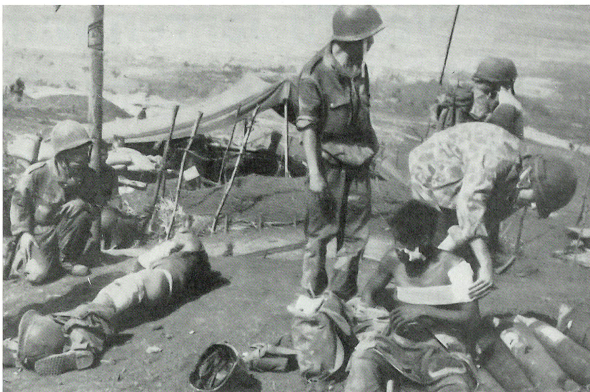
Frühjahr 1954: Verwundeten-Sammelstelle in Dien Bien Phu.

Das Buch von Vincenz Oertle «Endstation Algerien – Schweizer Fremdenlegionäre der 1950er Jahre» ist längst in zweiter erweiterter Auflage erschienen. 354 Seiten mit zahlreichen Fotos und Dokumenten. Preis Fr. 39.–. Zu beziehen bei: Verlag und Druckerei «Appenzeller Volksfreund», 9050 Appenzell AI.