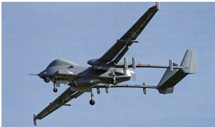
Der andere Konkurrent, ebenfalls aus Israel: Die Heron 1 von AIA.