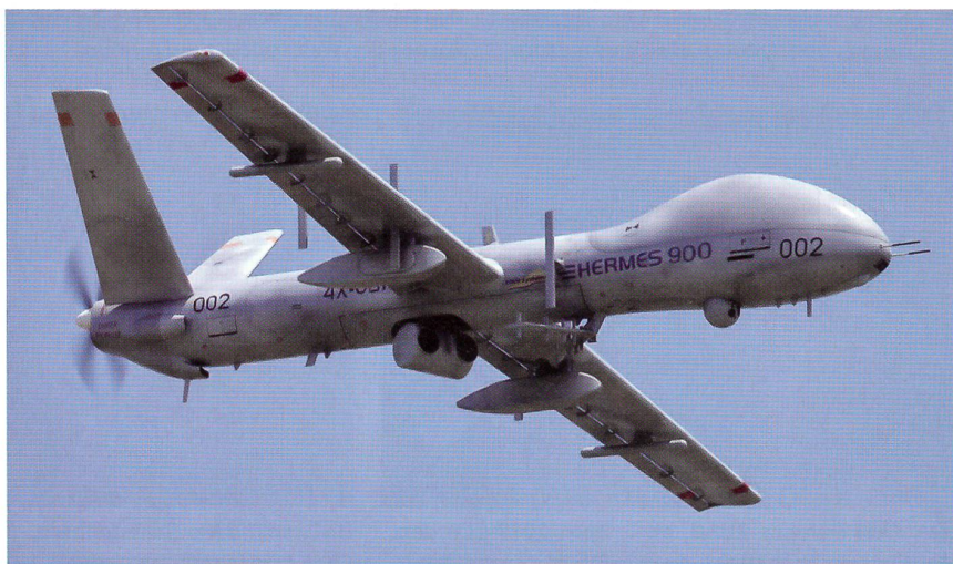
Der eine israelische Konkurrent: Die Drohne von Elbit, Hermes 900.

Das neue Drohnensystem soll grundsätzlich jene Aufgaben erfüllen, die bereits die ADS 95 erbringt. Die wichtigste Aufgabe bleibt die Nachrichtenbeschaffung für die Armee. Daneben leisten die Drohnen unter anderem ausgezeichnete Dienste für das Grenzwachtkorps.