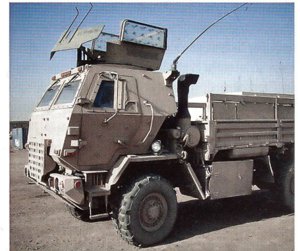
Geschützter Geländelastwagen des Herstellers Oshkosh Defence.

Oshkosh Defence hat in zwei Jahren Vertragsdauer 10 000 Fahrzeuge der Kategorie «Taktischer LKW» ausgeliefert. Die Fahr-