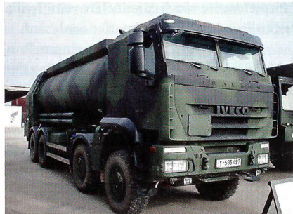
Geschützter Tankwagen des Typs Iveco Trakker der Bundeswehr.

Die Bundeswehr erhält 13 LKW des Typs Trakker von Iveco mit Pritschau Aufbau und geschützter Fahrerkabine. Die Fahrzeuge gehören zu den geschützten Transportfahrzeugen