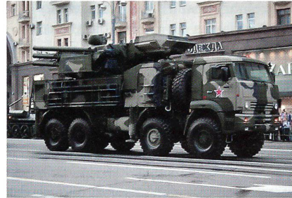
Fliegerabwehrsystem Panzir-S anlässlich einer Militärparade in Moskau.

Die russische Luftabwehr hat bei einer Übung erstmals einen echten Marschflugkörper mit modernsten Abfangraketen des Typs Panzir-S abgefangen. Bislang wurden