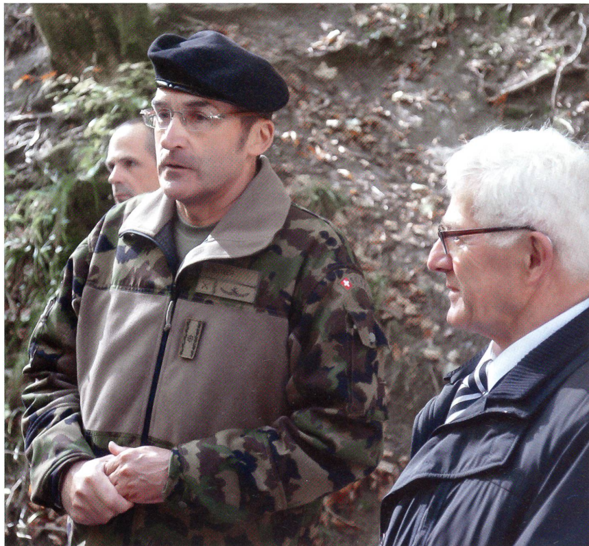
Brigadier Bernhard Bütler, Kdt FU Br 41, mit Landesfähnrich Melchior Looser.

Speziell wies er im Zusammenhang mit der WEA auf die verbesserte Kaderausbildung hin. Das Abverdien soll wieder eingeführt werden und eine Kaderausbildung findet erst nach dem Absolvieren einer ganzen Rekrutenschule statt. Als grosse Auf-