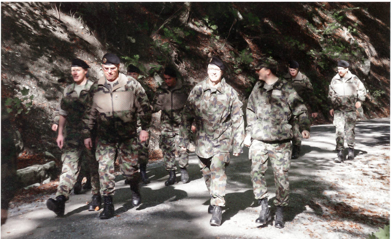
Rapport einmal anders: Den Rapportteilnehmern der FU Br 41 wurde eine zünftige Marschleistung abverlangt.