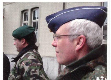
Stammgast in Herisau: Oberstlt i Gst Rainer Konrad, der deutsche Attaché.