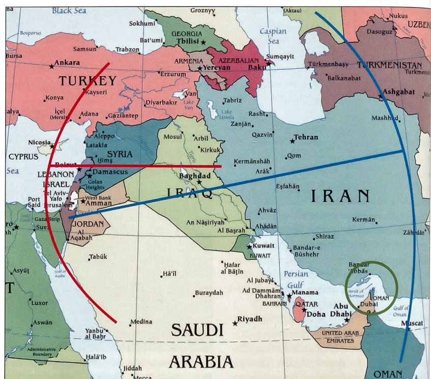
Rot: Reichweite von Irans Shahab-3-Rakete. Blau: Aktionsradius von Israels Luftwaffe. Grün: Die Strasse von Hormuz, durch die ein Drittel des Welterdöls kommt.

ihre verdeckten Aktionen von einem Stützpunkt zwischen Hadera und Haifa an der Mittelmeerküste aus. Die