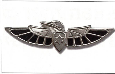
Das Emblem der Jechidat Shaldag.