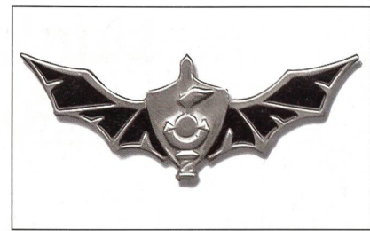
Das Emblem der Shayetet 13.