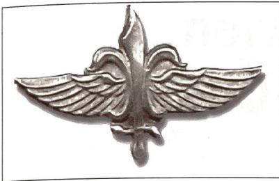
Das Emblem der Sayeret Matkal.