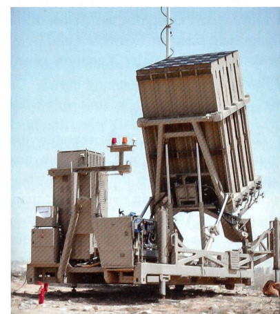
Die «Eiserne Kuppel» der Israel-Flab.

Gaza ist nur eine Front. Weit gefährlicher als die Hamas ist im Norden die Hisbollah. Zum Schutz von Galiläa wartet auf die israelische Flab eine Herkules-Aufgabe.