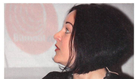
... wir müssen das nur wollen!»