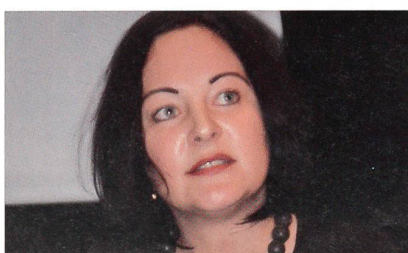
... und Burn-out können wir ankämpfen ...