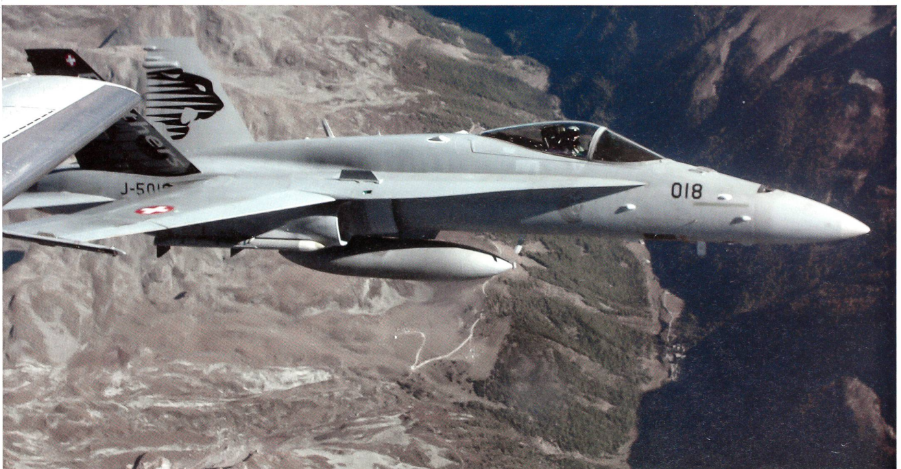
Der grosse Moment: Der Kampfflieger nähert sich dem zivilen Flugzeug auf 20 Meter und nimmt mit dem Piloten Blickkontakt auf.