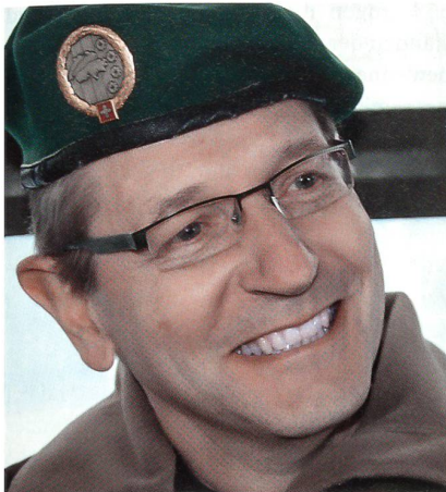
Divisionär Jean-Marc Halter, Kommandant des WEF-Einsatzes 2012.

Wahrnehmung der Aufgaben des Bundes (namentlich zugunsten des EJPD und des EDA).