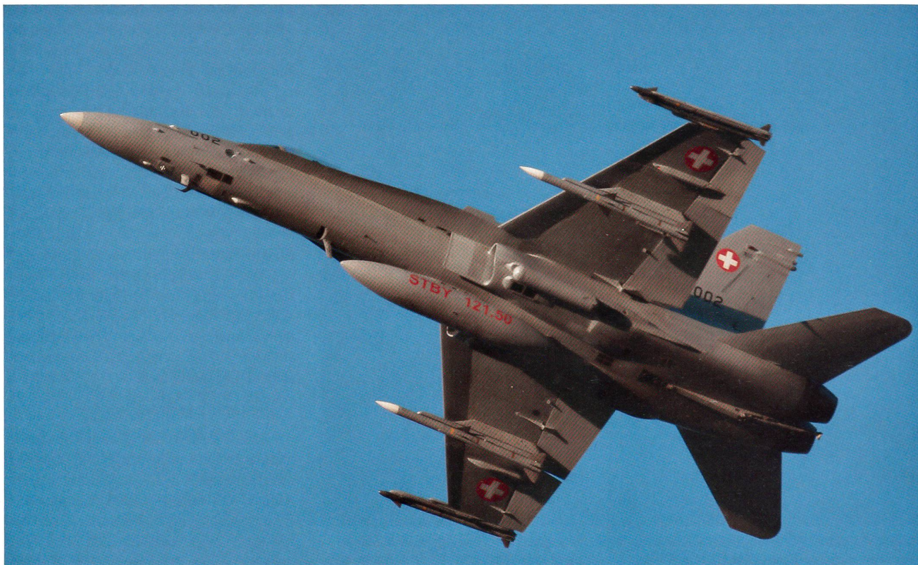
F/A-18C Hornet in der Standardbewaffnung. Zwei AIM-120B und zwei AIM-9X, in der Mitte ein Tank.

Tiger über die Fähigkeit und die Sensorik, aus einer höheren Fluglage in tiefere Regionen – zum Beispiel Täler unter den Wolken – blicken zu können.