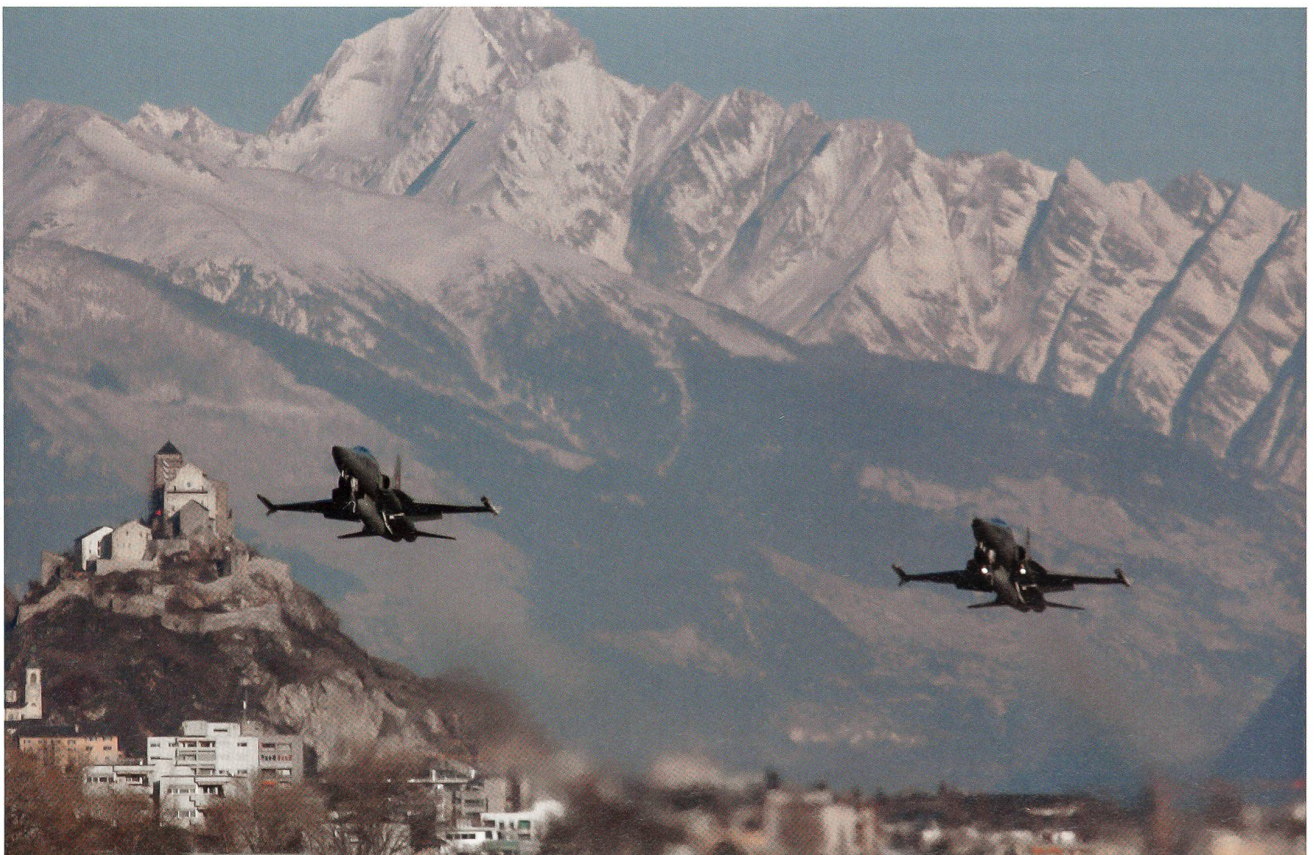
Die F-5E Tiger kamen als Backup während dem WEF zum Einsatz. Hier vor der imposanten Kulisse von Sion.

Nach knapp zehn Minuten Flug auf dem CAP-Kurs und einer Reihe von überprüften Signalen, von denen keines Anlass zur Besorgnis gab, wird «Falcon 11» vom AOC zu einer Trainingsmission aufgerufen.