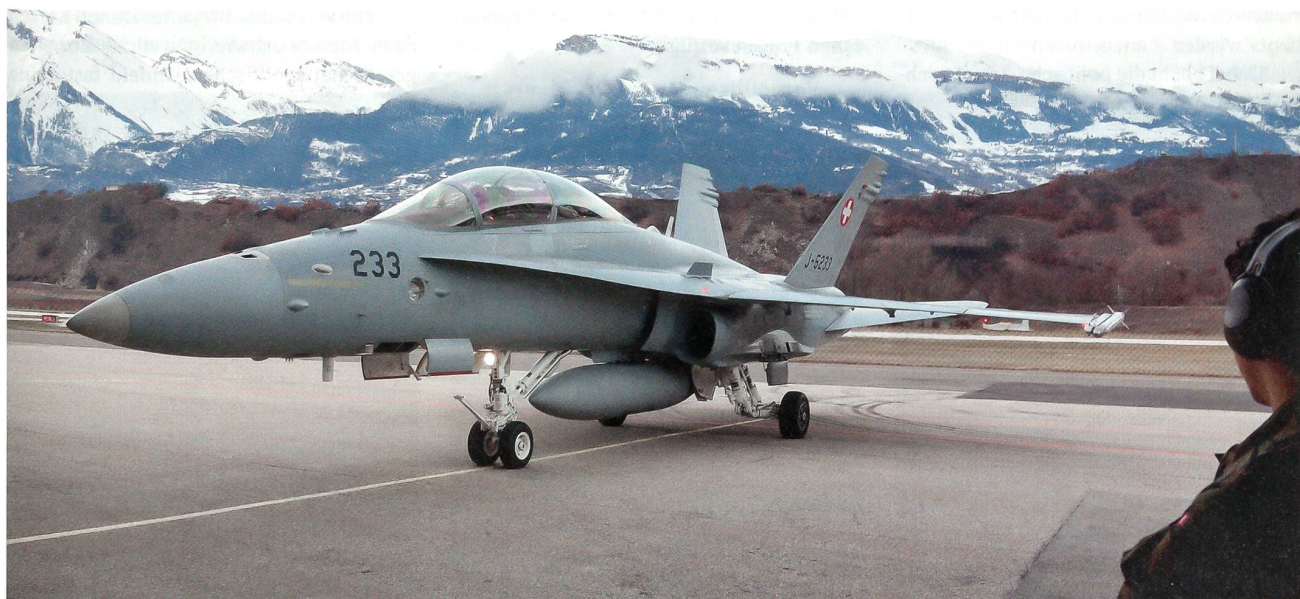
Nach dem Einsatz rollt J-5233 in die Box zurück.