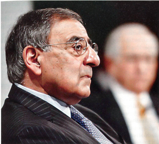
Ein aufmerksamer Zuhörer: Leon Panetta, Chef des Pentagons.