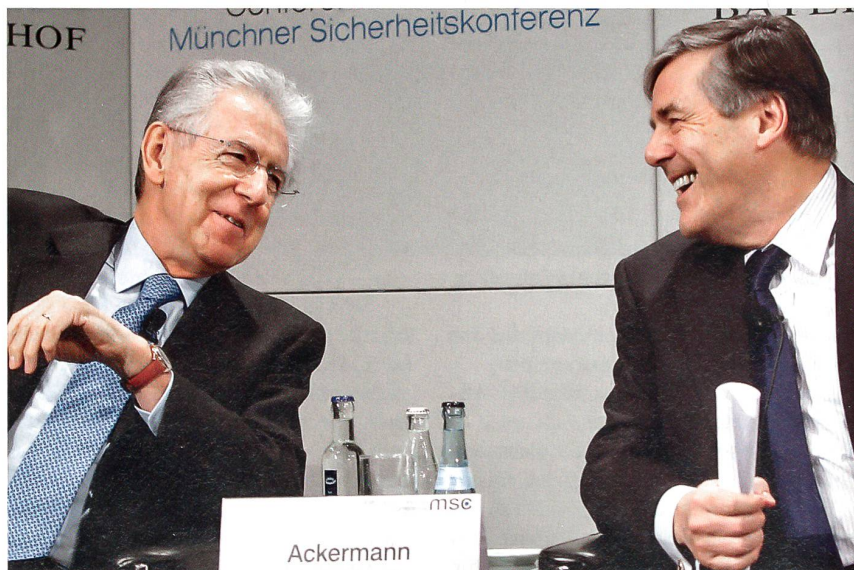
Italiens neuer Regierungschef Mario Monti und Josef Ackermann, Deutsche Bank.