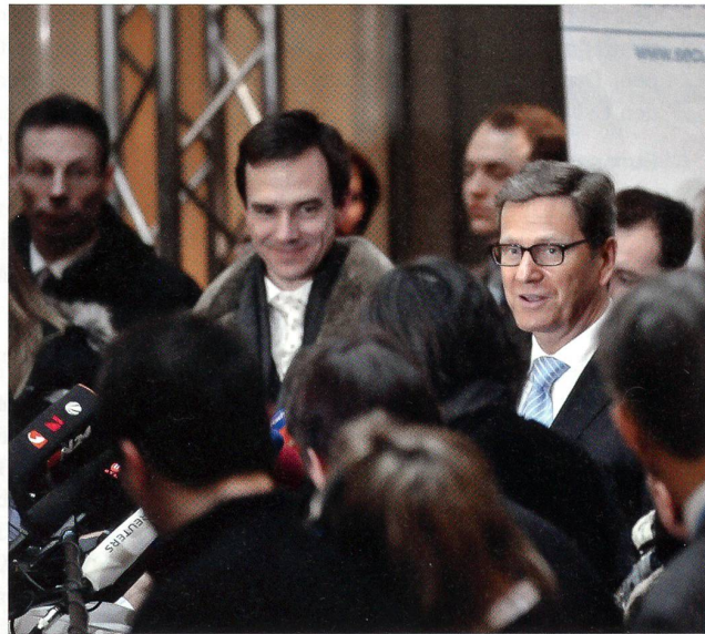
Aussenminister Westerwelle stellt sich den Korrespondenten.

Hof. Die Staatssekretärin suchte ihren russischen Widerpart in Anbetracht der Hiobsbotschaften aus Homs zum Einlenken und einer schnittigen Resolution zu bewegen.