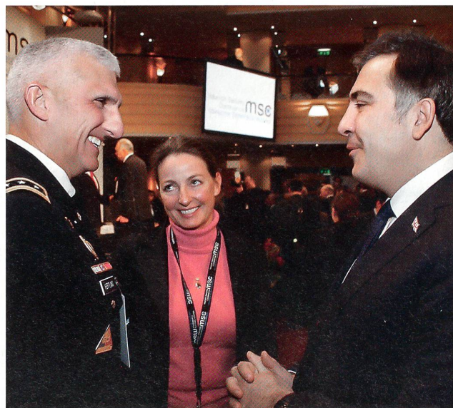
General Hertling, USA, und Micheil Saakaschwili, Georgien.