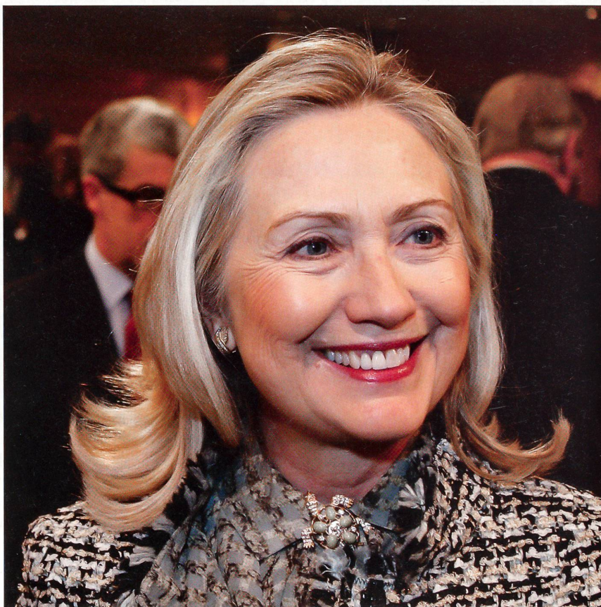
Hillary Clinton am 4. Februar 2012 – vor den gescheiterten Syrien-Verhandlungen.

Doch eines nach dem anderen. Beginnen wir mit der Konfrontation, die den ganzen 4./5. Februar beherrschte. Ausgerech-