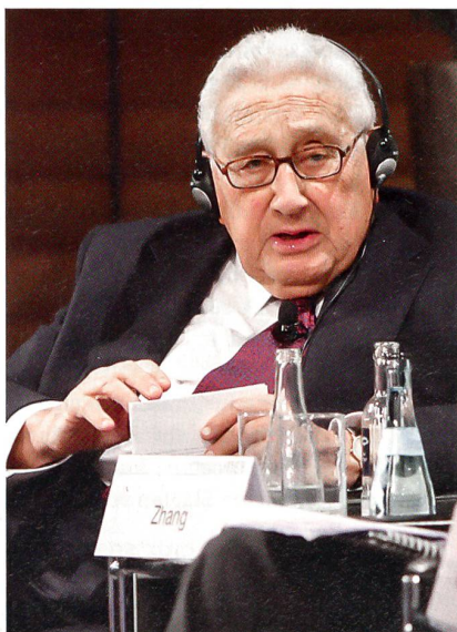
Rüstig mit 89 Jahren: Henry Kissinger.