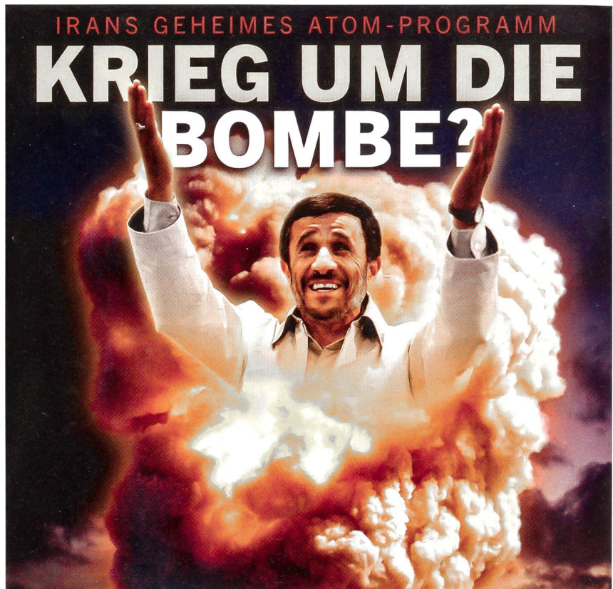
Auf Seite 1 stellt der SPIEGEL die Frage, die die Welt bewegt: Krieg um die Bombe?

Damit verdoppelt sich die Zahl der israelischen Tankflugzeuge. Aber auch so bleibt fraglich, ob Israel für eine längere Operation genügend Tanker einsetzen