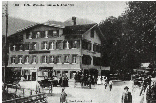
Hersche wuchs im Gasthof «Weissbadbrücke» bei Appenzel auf, wo seine Eltern als Wirtsleute tätig waren.

Rüstungskonzern «Getewent» im sudeten-deutschen Gablonz an.