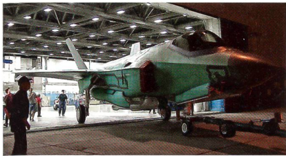
Bild des Rollouts der ersten niederländischen F-35 Lightning II.

Die erste F-35 Lightning II für die niederländische Luftwaffe, welche in Fort Worth bei Lockheed Martin gebaut wurde, hat die Montagehallen verlassen. Die Königlich Niederländischen Luftstreitkräfte werden die F-35 mit den konventionellen Start- und Landeeigenschaften erhalten. Das erste Flugzeug wird vor allem zur Ausbildung des fliegenden und logistischen Personals die-