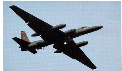
Aufklärungsflugzeug Lockheed U-2 Dragon Lady beim Start.

Das Aufklärungsflugzeug U-2, welches 1956 in Dienst gestellt wurde, bleibt bis 2025 im Dienst. Die 33 Maschinen, welche immer noch durch die U.S. Air Force eingesetzt werden, wurden seit 1994 für insge-