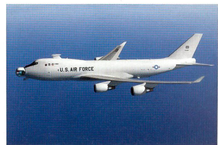
Fliegender Versuchsträger YAL-1A mit aktiviertem Laser.

Die U.S. Air Force hat aus Kostengründen das Airborne Laser-Programm eingestellt. Die Boeing 747-400F mit der Bezeichnung YAL-1A diene als fliegender Laser-