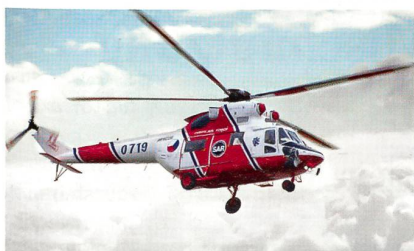
Polnischer Hubschrauber des Typs W-3 Sokol in SAR-Konfiguration.

Der polnische Hubschrauberhersteller PZL-Swidnik, ein Unternehmen von AgustaWestland, hat mit dem polnischen Verteidigungsministerium einen Vertrag über die Lieferung von fünf neuen mittleren Transport- und Mehrzweckhubschraubern des zweimotorigen Musters W-3WA Sokol unterzeichnet. Im Rahmen dieses Auftrags im Wert von rund 90 Millionen Euro werden auch 14 vorhandene Hubschrauber modernisiert. Die fünf neuen Hubschrauber wer-