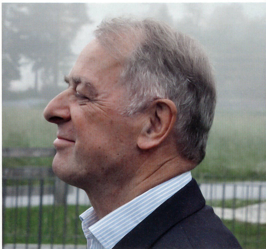
Kandersteg, 26. Mai 2012: Adolf Ogi kurz vor seinem 70. Geburtstag anlässlich der Vorstellung des neuen Buches aus dem Weltbild-Verlag: «So wa(h)r es».