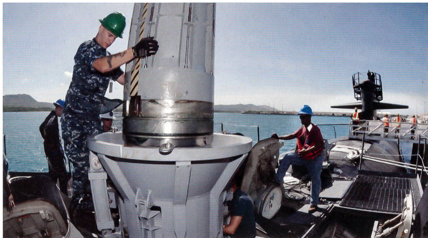
Ein «Tomahawk»-Marschflugkörper wird in Guam an Bord des U-Bootes USS «Oklahoma City» (SSN 723) genommen.

Ferner können sie bis zu 60 Special Forces («Seals») aufnehmen. Für letztere verfügen die Boote – wie auch einzelne Jagd-U-Boote – über spezielle Unterwasserstartsysteme, die sogenannten Advanced Seal Delivery Systems (ASDS), welche achtern auf dem Rumpf des Bootes aufgesetzt mitgeführt werden. In Nähe des Einsatzraumes gelangen die Seals durch eine Schleuse vom U-Boot in ihr ASDS Fahrzeug.