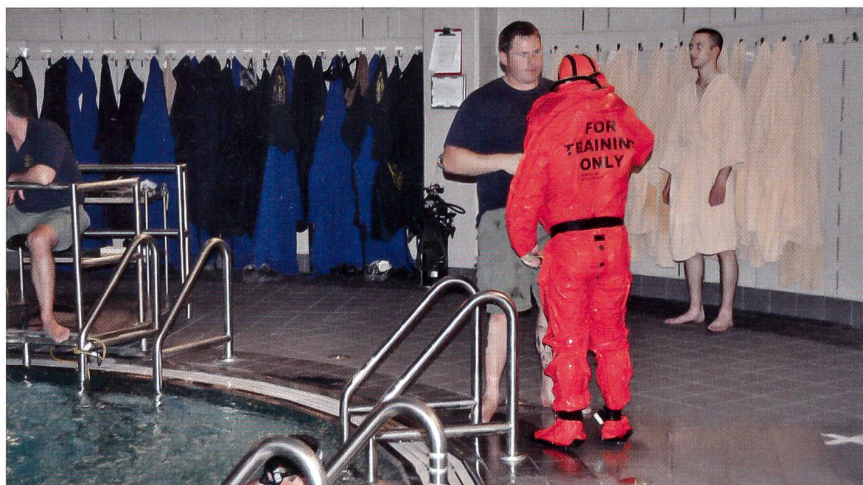
In der Submarine Learning Facility von Groton in Connecticut lernen die U-Boot-Leute in einem Tauchturm mit einer Wassertiefe von 12 m einen «Notausstieg». Dabei ziehen sie spezielle Anzüge an, die ihnen auch auf den U-Booten zur Verfügung stehen. Ein echter Notausstieg sieht vor, dass die U-Boot-Fahrer aus 200 m Tiefe in einer Minute an die Wasseroberfläche gelangen müssen.