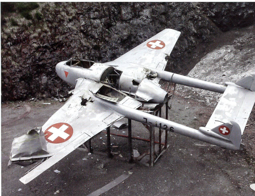
Beschuss einer Vampire beweist die Effektivität von neuer Fliegerabwehrmunition.

Der Schutzschirm über Israel wird dabei – entgegen dem amerikanisch-europäi-