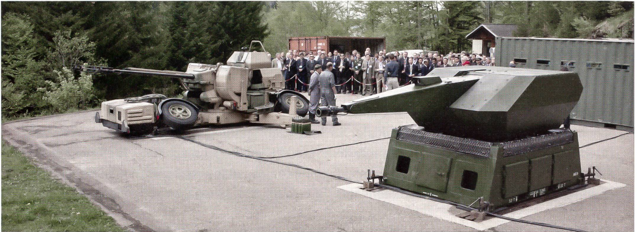
Die 35mm Fliegerabwehrkanone 63/90 neben dem modernen Oerlikon Skyshield-Turm.

ningsweltmeister zu sein. Jedes Jahr findet mit dem WEF ein scharfer Einsatz statt, in welchem Personal und Systeme auf ihre Einsatztauglichkeit überprüft werden. Dadurch wird schnell klar, dass nicht nur bei Kriegs- oder Befriedungseinsätzen, sondern bei der Durchführung jedes Grossanlasses die dritte Dimension beachtet und abgedeckt werden muss.