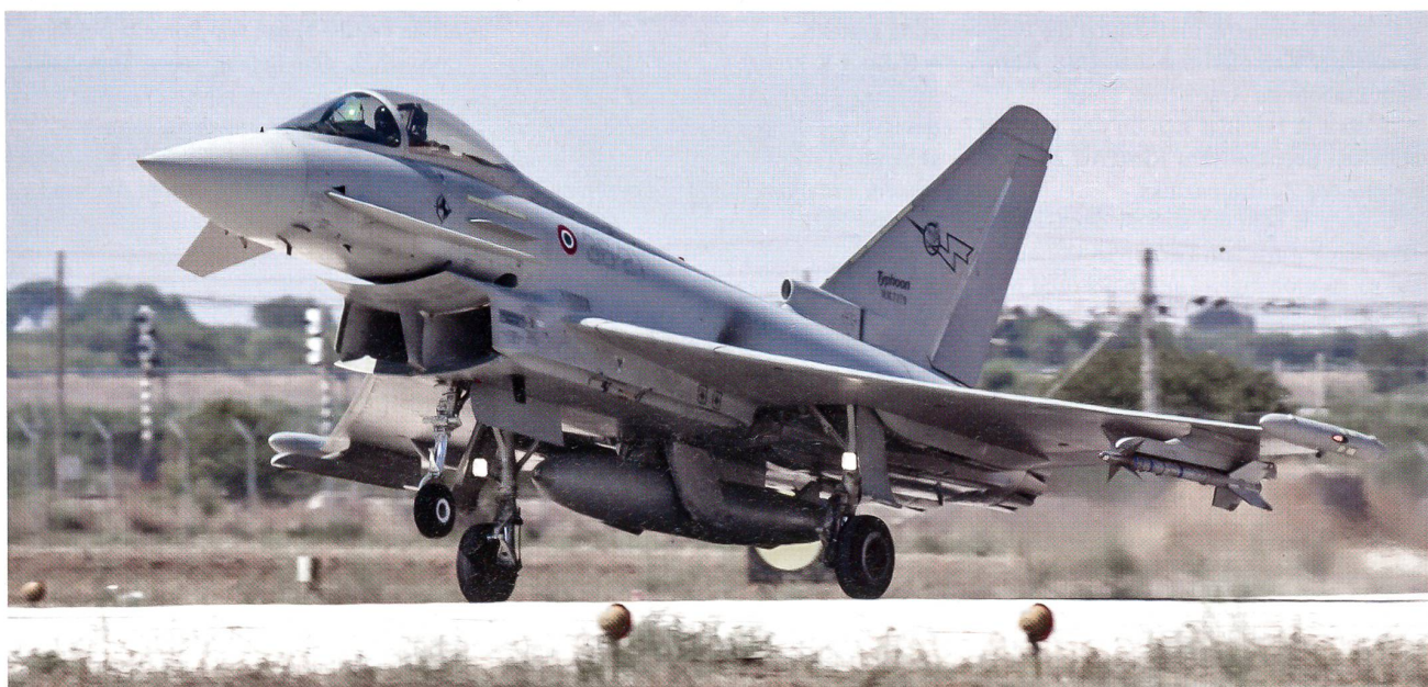
In der italienischen Luftwaffe lösen jetzt die in Europa hergestellten Eurofighter Typhoon zügig den amerikanischen F-16 ab.

Im NATO-Luftkrieg gegen den libyschen Herrscher Gaddafi spielte Italien eine bedeutende Rolle. Einerseits stellte der Mittelmeerstaat für die Kampagne gegen Gaddafi die besten Stützpunkte zur Verfügung; andererseits nahm die italienische Luftwaffe aktiv an den Operationen gegen das Gaddafi-Regime teil. +