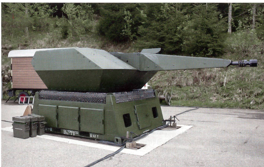
Die Zukunft der bodengestützten Luftverteidigung: Skyshield.

Nur so kann ein effektiver und wirksamer Luftverteidigungsschirm über Grossanlässen, aber auch im Kriegsfall, aufgespannt werden. +