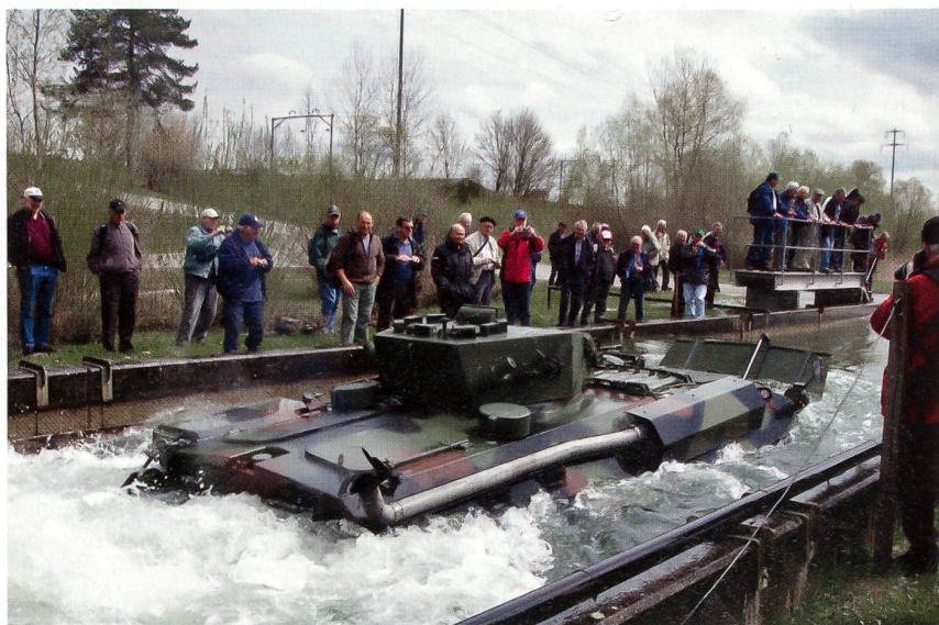
Schwimmfähiger Piranha im Wasserkanal.

Die Verkaufserfolge widerspiegeln sich in der Tatsache, dass z.B. 138 Fahrzeuge an Belgien, 18 an die brasilianische Marine, 21 an die spanische Marineinfanterie, 130 an die Bundeswehr, wobei hier Teile in Deutschland gefertigt wurden, jedoch zu 70% Schweizer Inlandproduktion darstell-