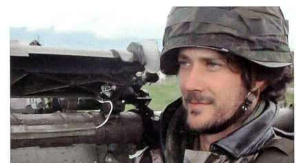
Lehrverband Flab 33: Volltruppenübung CHESS TRIO mit Kanone, Stinger und Rapier