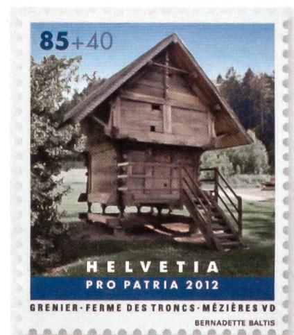
Die Ferme des Troncs in Mézières/VD.

Dank Sammlungen in der Schweizer Bevölkerung kann Pro Patria jedes Jahr viele Projekte unterstützen, welche die dauerhafte Erhaltung und fachgerechte Pflege von Baudenkmalern zum Ziel haben. Die jeweiligen Förderbeiträge stammen aus den verschiedenen zweckgebundenen Fonds, welche unsere Stiftung verwaltet. Ein stark beanspruchter Fonds ist derjenige für «Schweizer Kleinbauten». In den vergangenen Jahren wurden rund 400 sorgfältig ausgewählte Gesuche bewilligt und über