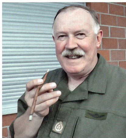
Der General mit seiner Krummen.