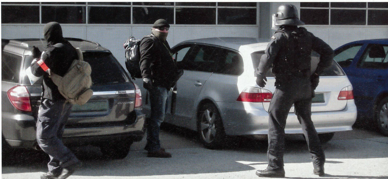
Auch das gehört zur sicheren Schweiz: Der Zugriff des Militärpolizei-Spezialdetachementes gegen Waffenschieber auf dem Ceneri.