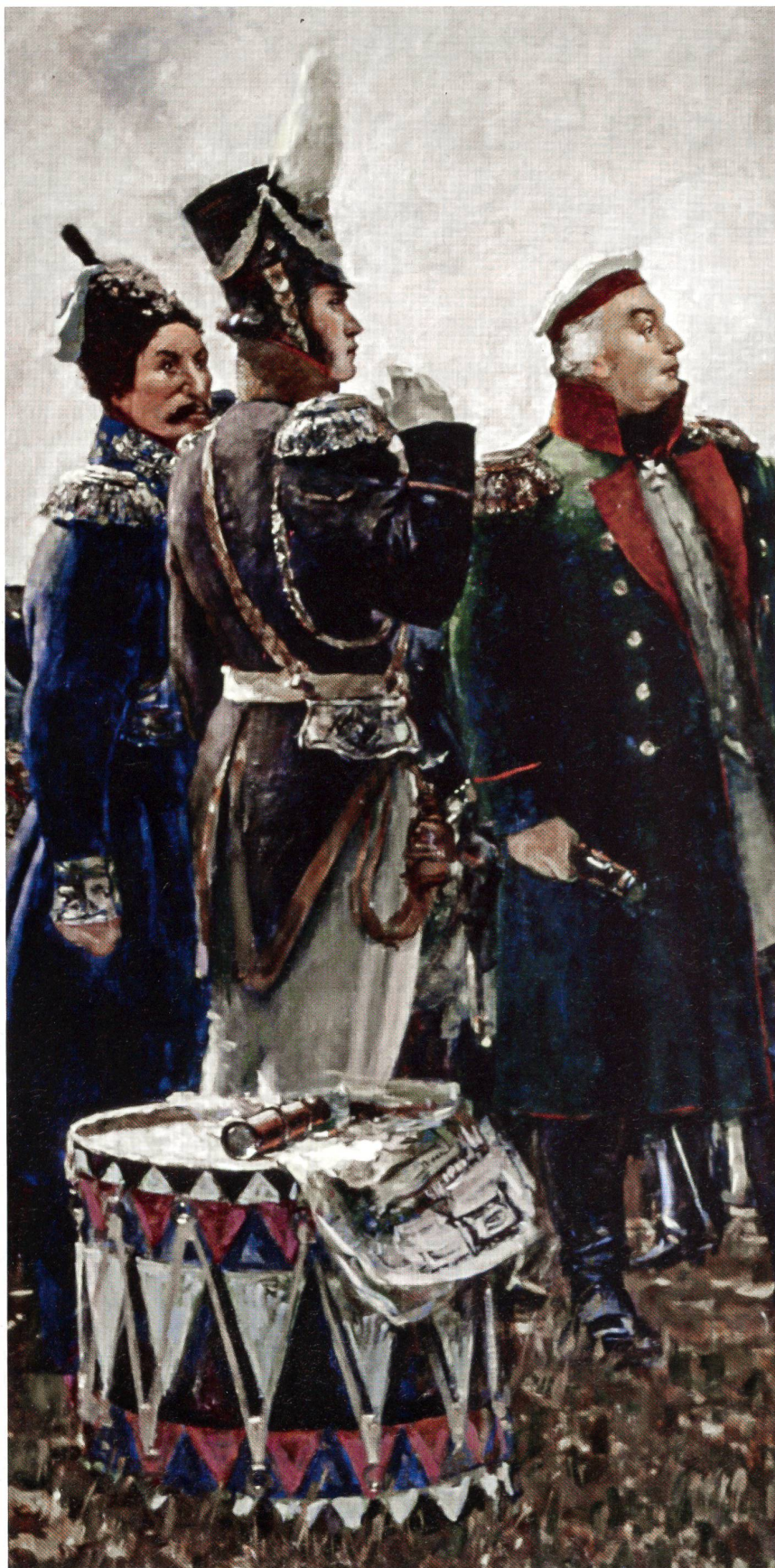
Borodino: Der russische Heerführer Michail Kutusow im grünen Generalsmantel.

sprengen – doch die Zünder versagen, und die mächtige Festung bleibt stehen. Jetzt ist Napoleon Bonaparte erstmals in seinem Leben der Gejagte, nicht mehr der Jäger.