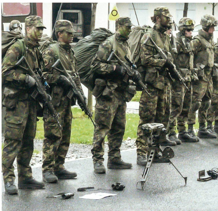
Moderne Infanterie: Kader und Soldaten der Inf RS 12 von Chur in der 17. Woche.

Dies kann sie aber nur wunschgemäss ausführen, wenn die Bereitschaft erhöht wird, eine verbesserte Ausbildung Grundlage ist und wenn man eine Vollausrüstung