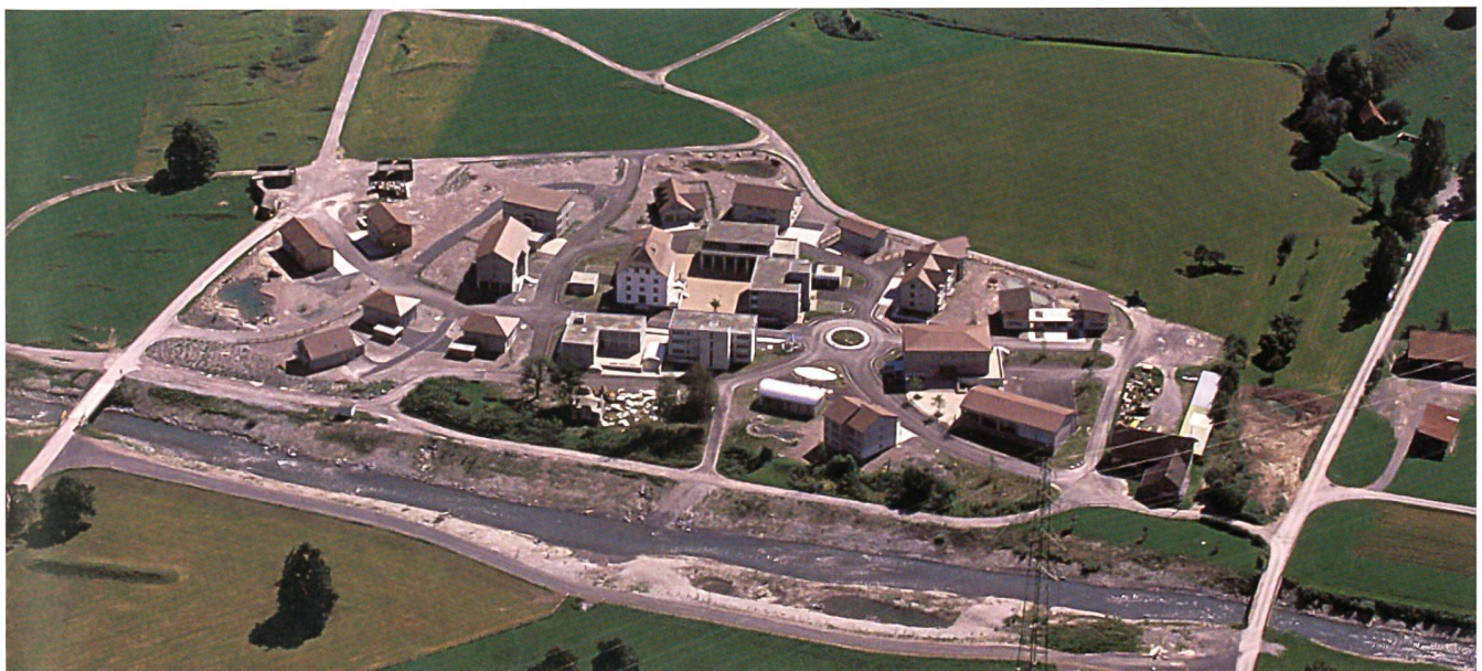
Das Bild zeigt das bestens ausgebaute Ortskampfdorf Aeuli in der Paschga auf dem Waffenplatz Walenstadt. Vorne die Seez.