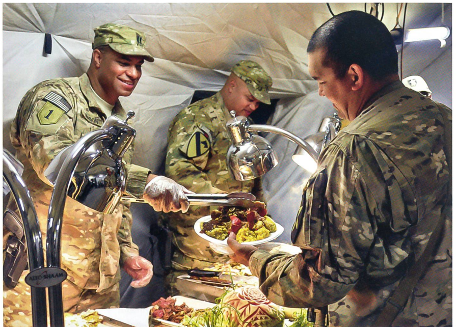
Essensausgabe im Verpflegungszelt einer amerikanischen Einheit.

Ab 2017 verbleiben 33 Kampfbrigaden: 14 Infanterie-, zwölf Panzer- und sieben Stryker -Brigaden. Darunter befinden sich zwei in Europa stationierte Verbände, die vom Oberkommando des amerikanischen Heeres