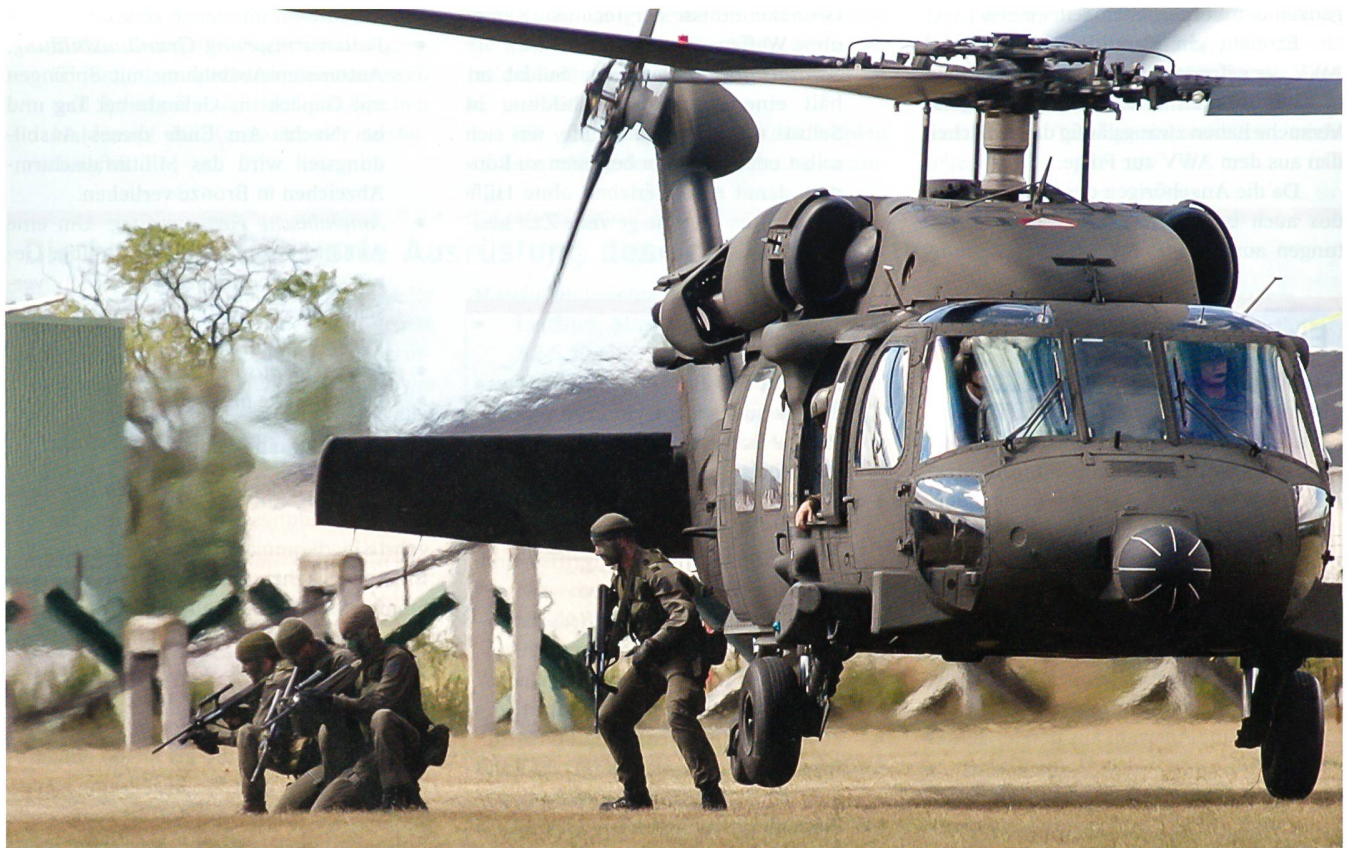
Eines von verschiedenen Transportmitteln des Jagdkommandos: Der S-70A-42 Black Hawk.

Um überhaupt zum Grundkurs zugelassen zu werden, muss vorgängig das sogenannte Auswahlverfahren (AWV) erfolgreich bestanden werden. Die Zulassungsbedingungen zum vierwöchigen AWV