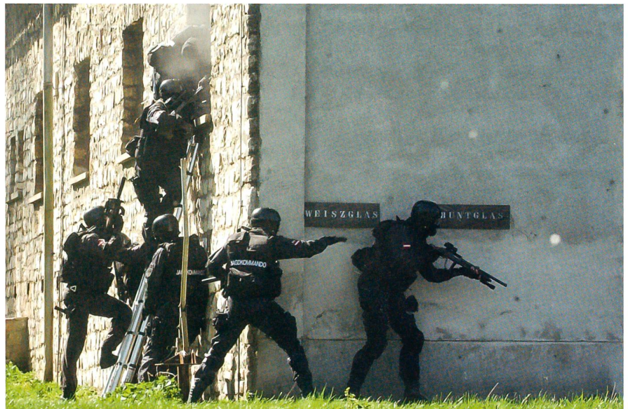
Das österreichische Jagdkommando beim entschlossenen Zugriff.

Hintergrund dieser starken Anlehnung war der Umstand, dass 1958 und somit zwei Jahre nach der Aufstellung des Bundesheeres der Zweiten Republik zwei Offiziere der Infanteriekampfschule an der Special Warfare School in Fort Bragg, North Carolina, die Luftlandeausbildung bei der 82. US-Infanteriedivision durchliefen und 1961 erneut Offiziere in den USA den Special