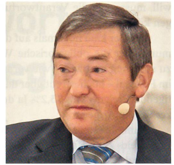
Nationalrat Jakob Büchler.