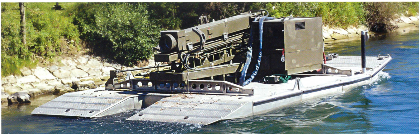
Schwimmramme der Armee.

hölzerne Balkenplatten auf die Stahlträger versetzt und verschraubt. Rund 100 Mann brauchten dafür 24 Stunden. Die Kp könnte mit dem Vollbestand von 180 Mann die Brücke über längere Zeit betreiben.