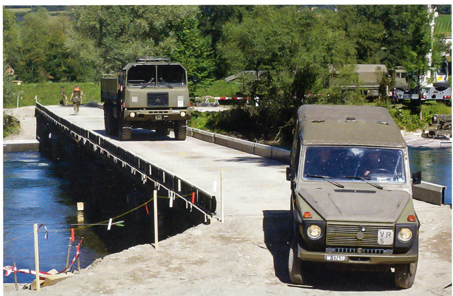
Erste Fahrzeuge passieren die Brücke.