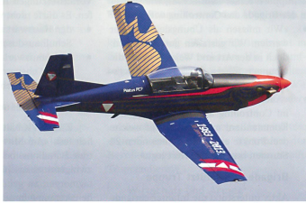
Österreichische PC-7 mit Sonderanstrich zum 30-Jahr-Jubiläum.