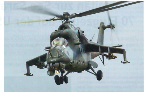
Kampfhelikopter MI-24 aus Tschechien beim Display.