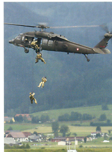
Black Hawk S-70 und Jagdkommando.