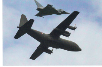
Eine C-130 Hercules wird von einem Eurofighter begleitet.