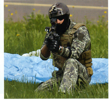
Ein Soldat des Jagdkommandos sichert ab.