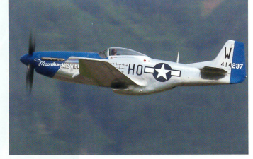
Oldtimerlegende P-51 Mustang bei der Vorführung.