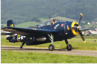
TBM-3E Avenger rollt zum Start.

Die Airpower 13 war in jeder Beziehung ausgezeichnet organisiert und bot den Zuschauern eine interessante und eindrucksvolle Flugveranstaltung. ☒