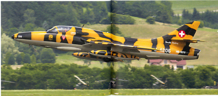
Der im Tigerlook bemalte Schweizer Hunter vom Fliegermuseum Altenrhein beim Start zur Vorführung.