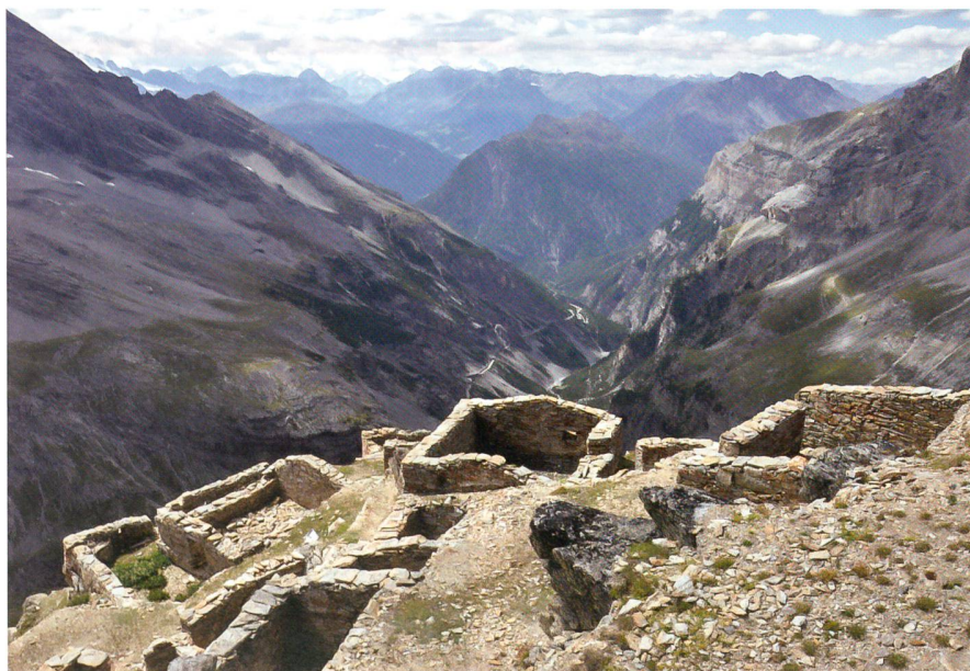
Eindrücklicher Blick in die Militärgeschichte: Alpini-Unterkunft am Filone-Scorluzzo.